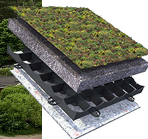
Sedum + nativas Sustrato Geotextil Drenaje Geotextil con retención