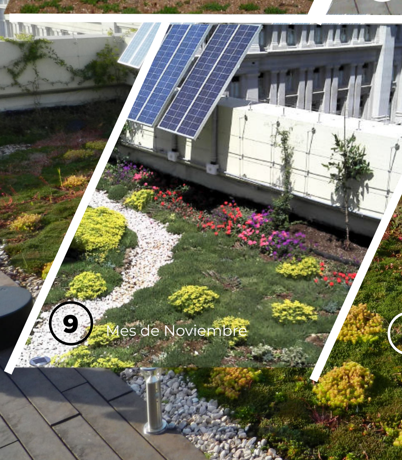
9 Mes de Noviembre