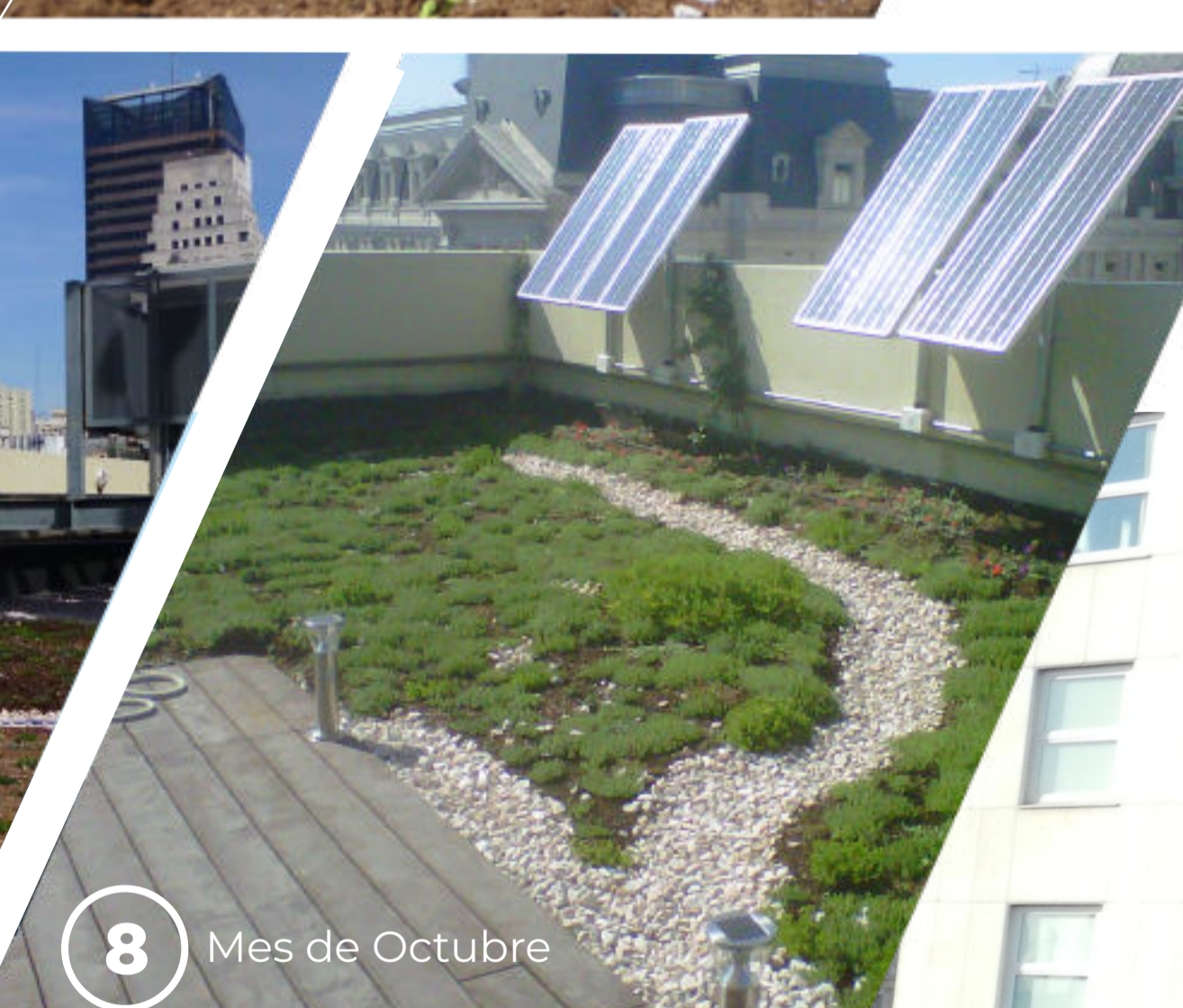
8 Mes de Octubre