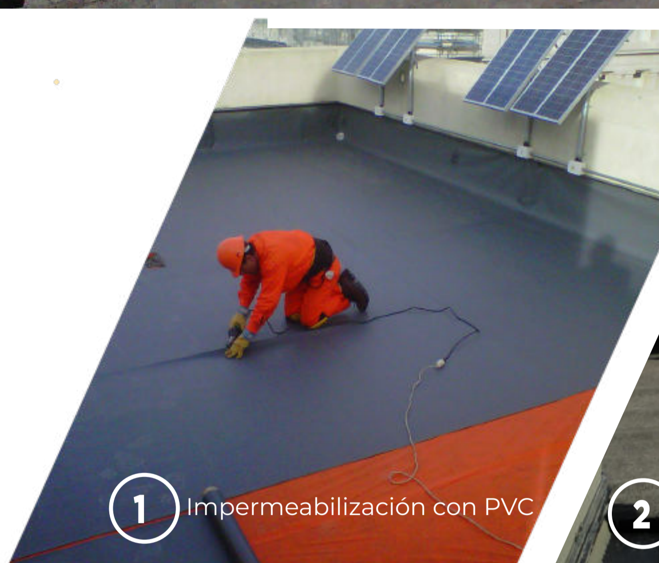
1 Impermeabilización con PVC