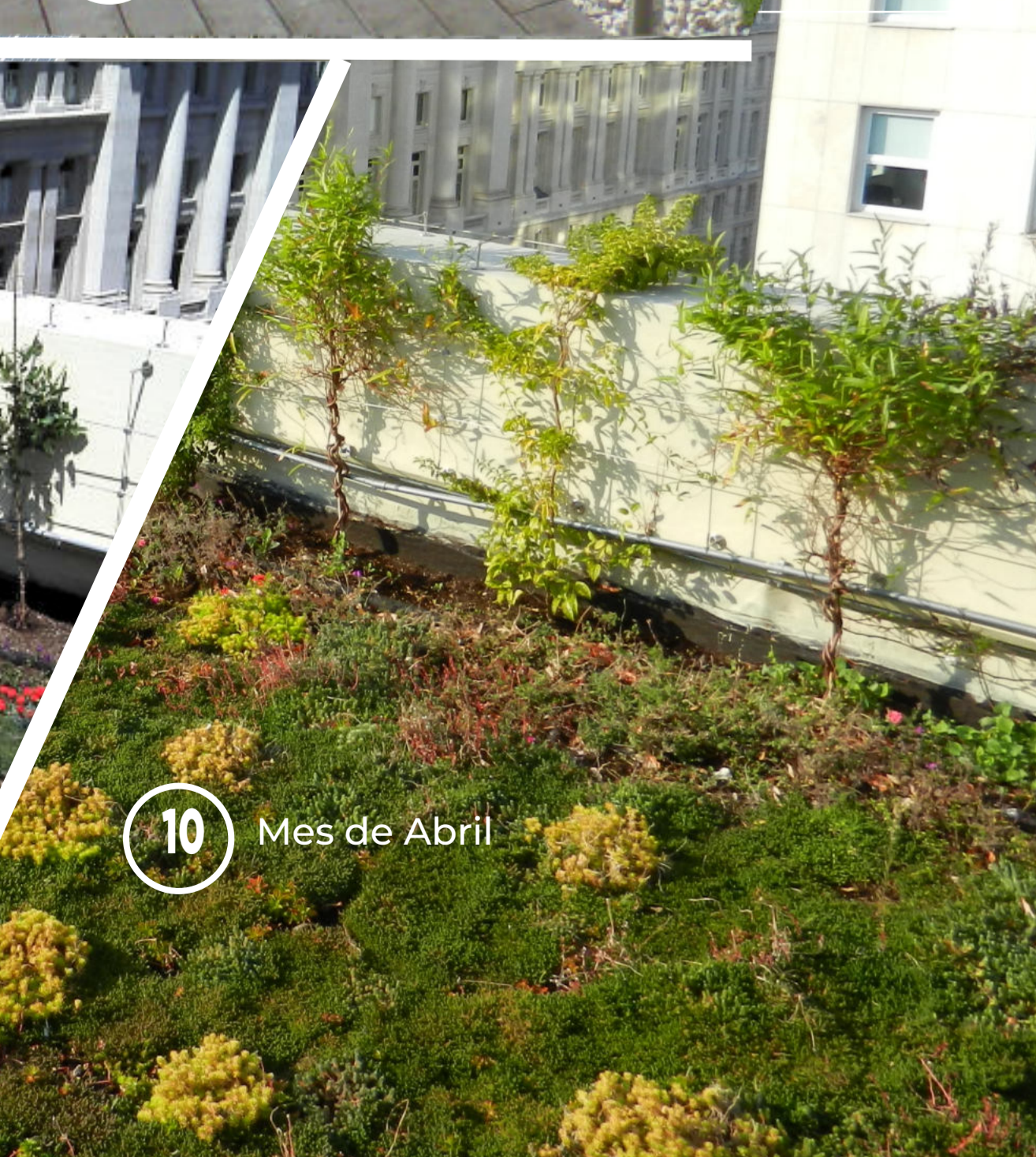
10 Mes de Abril