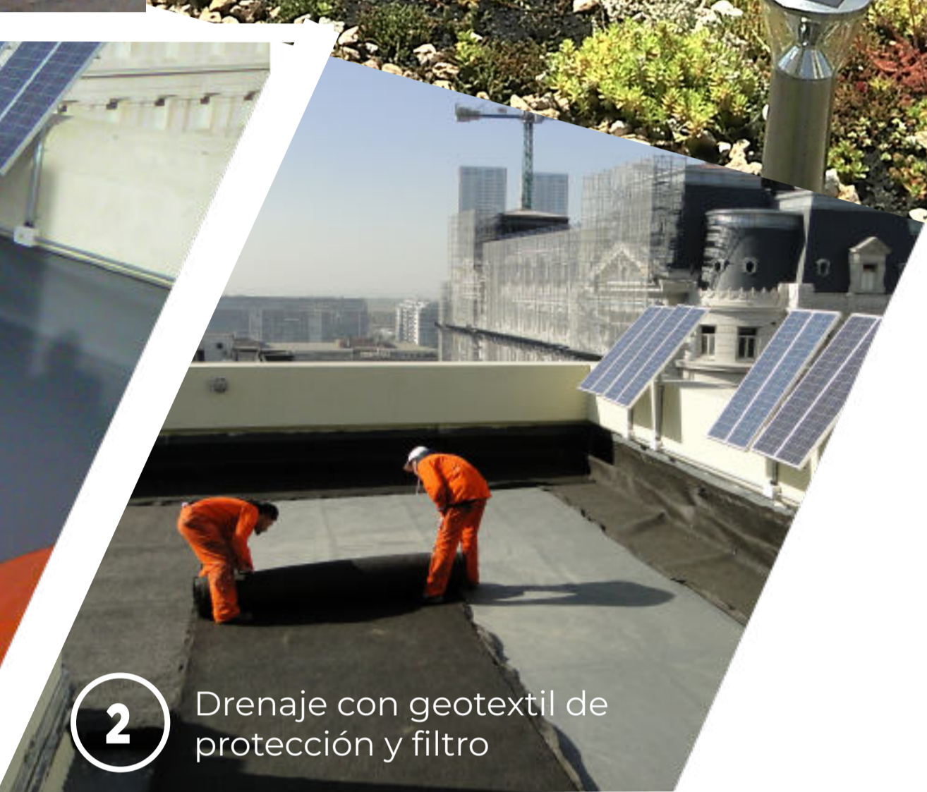
2 Drenaje con geotextil de protección y filtro