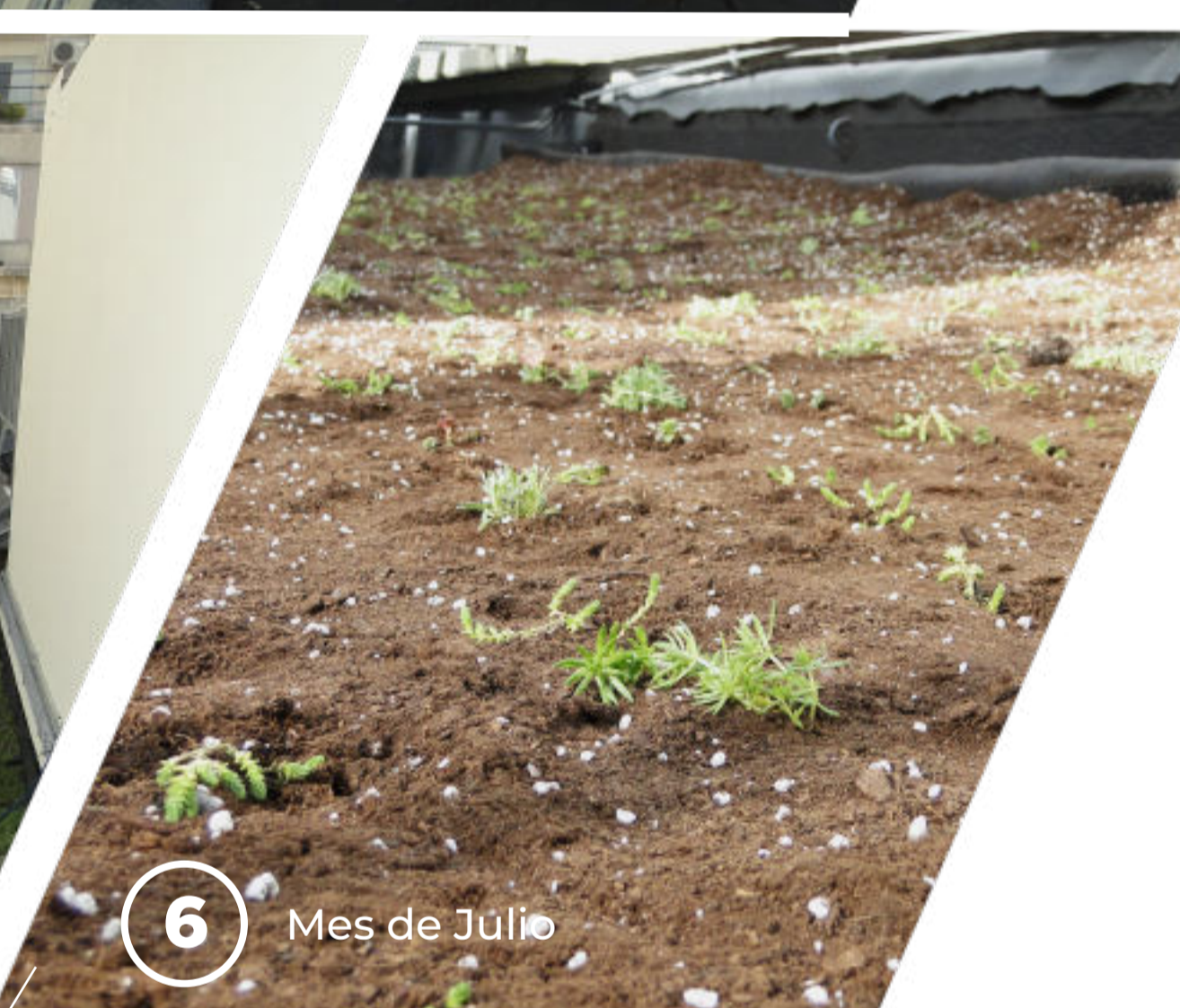
6 Mes de Julio