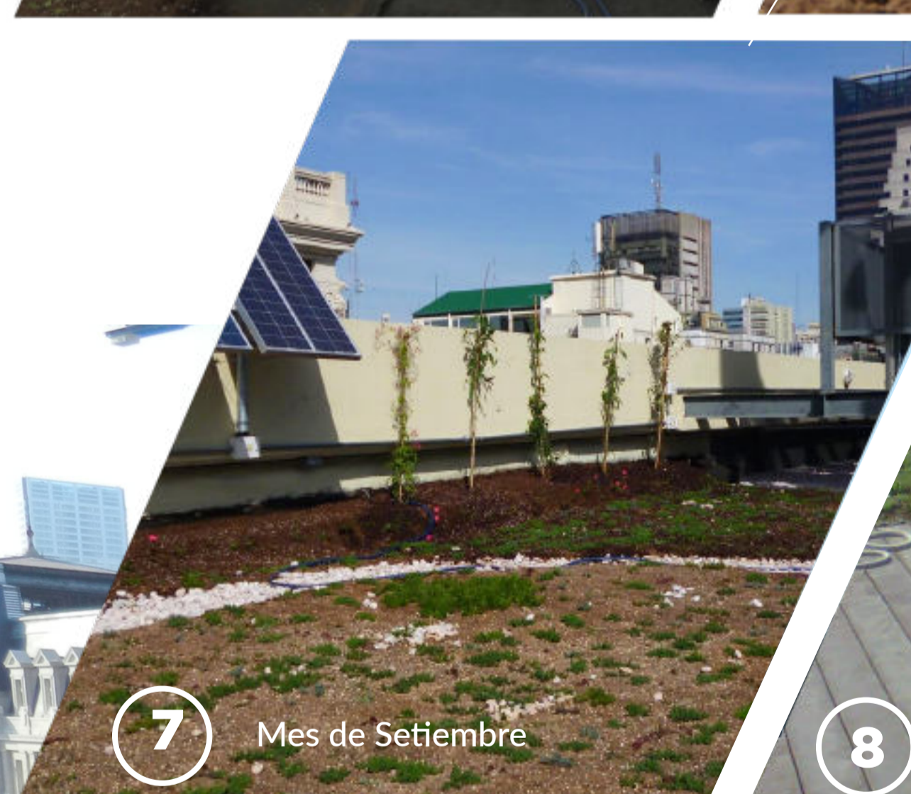
7 Mes de Setiembre