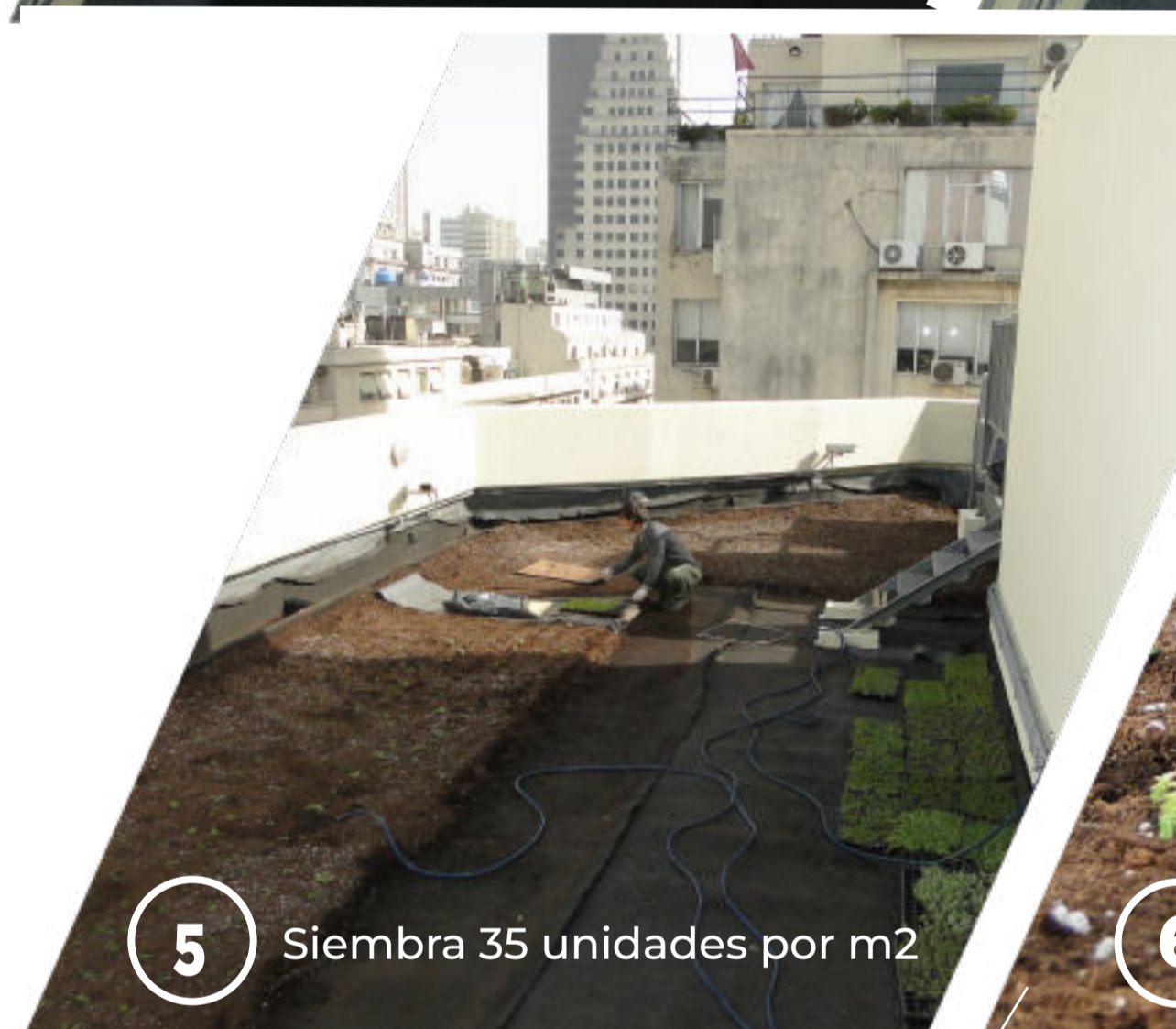
5 Siembra 35 unidades por m2