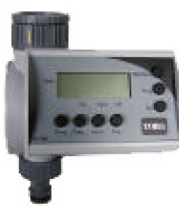
Toro Manual una boca.