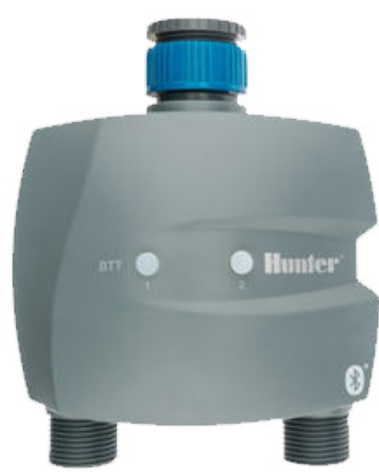
Hunter Bluetooth dos bocas

Estos equipos pueden ser programados manualmente o por Bluetooth.