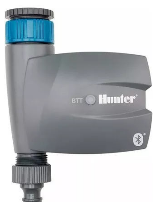
Hunter Bluetooth una boca